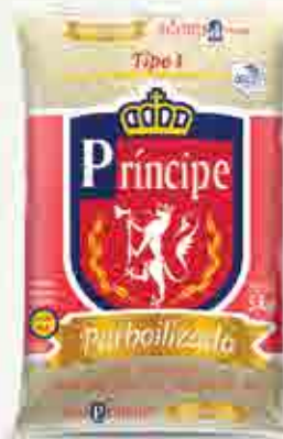
Arroz Príncipe Branco T1