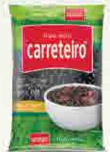
Feijão Carreteiro Preto T1