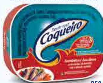
Sardinhas com Molho com Tomate