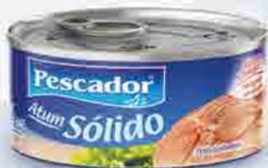
Atum Sólido - 170g