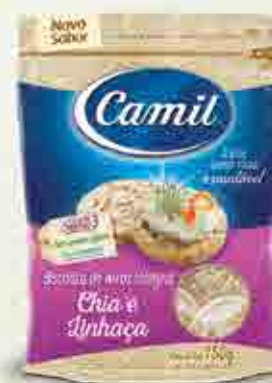
Biscoitos de Arroz Integral com Chia e Linhaça