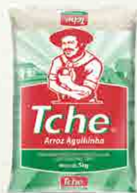
Arroz Tche Branco T5