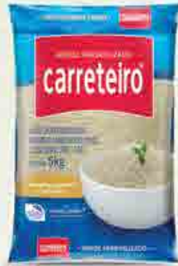
Arroz Carreteiro Parboilizado T1