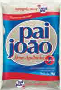
Arroz Pai João Branco T1