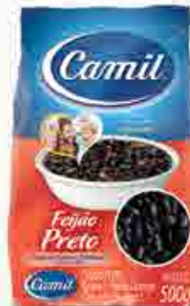
Feijão Preto - Tipo 1