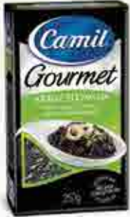
Arroz Selvagem Origem: EUA / Canadá

Uma linha de grãos selecionados com variedades de arroz vindas de diversos países. Um universo de sabores para receitas surpreendentes.