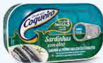
Sardinhas em Óleo