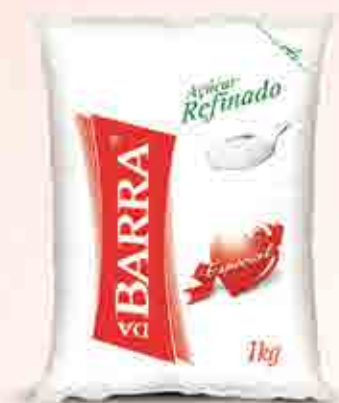
1kg Distribuição nacional

A Camil possui também outras marcas de açúcar para atender perfis de consumo de diferentes regiões do país.