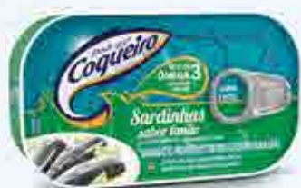
Sardinhas sabor Limão

Rico em Ômega 3 e cálcio, passa por um rigoroso sistema de qualidade. Não contém conservante e possui proteínas em abundância, sendo uma ótima opção de carne magra.