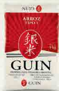
Guin Grão Longo