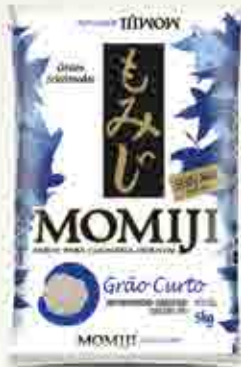
Momiji Grão Curto