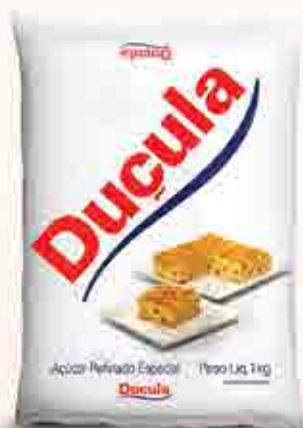
1kg Distribuição Regional SC - PR