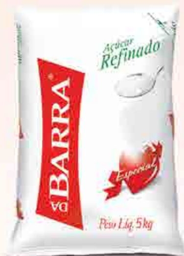
5kg Distribuição nacional