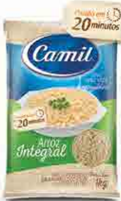
Arroz Integral Almofada