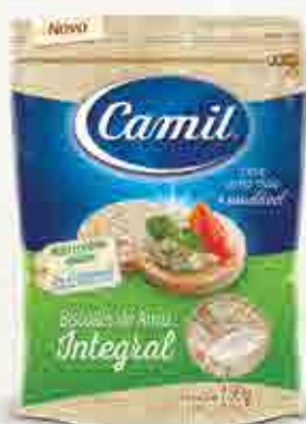
Biscoitos de Arroz Integral