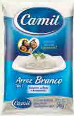
Arroz Branco - Tipo 1