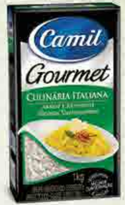
Culinária Italiana Origem: Itália e Uruguai