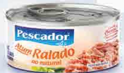
Atum Ralado em Água/Natural (Light) - 170g