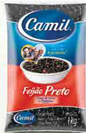
Feijão Preto - Tipo 1