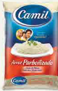
Arroz Parboilizado - Tipo 1