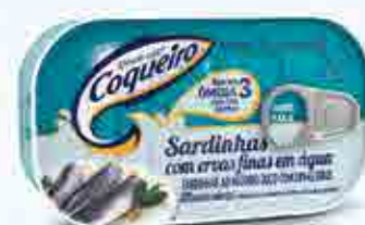
Sardinhas com Ervas Finas em Água