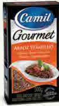
Arroz Vermelho Origem: Brasil