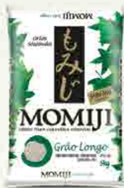
Momiji Grão Longo