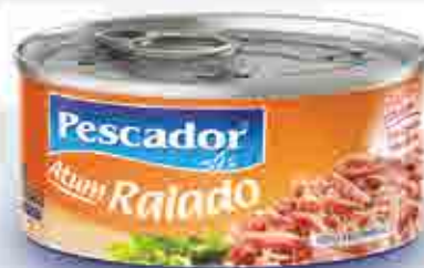
Atum Ralado - 170g