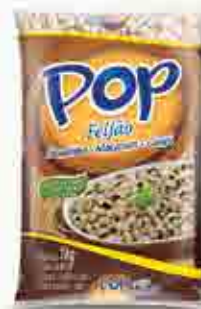
Feijão Pop Fradinho T1