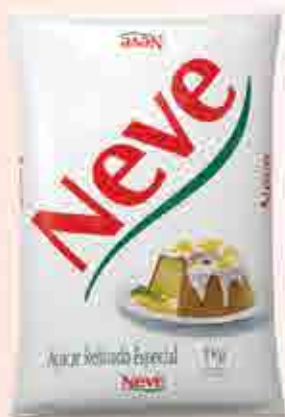
1kg Distribuição Regional RJ - ES - MG