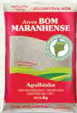
Arroz Bom Maranhense Branco T1