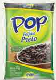
Feijão Pop Preto T2