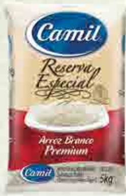
Arroz Reserva Especial - Tipo 1