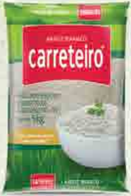
Arroz Carreteiro Branco T1