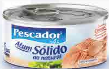
Atum Sólido em Água/Natural (Light) - 170g