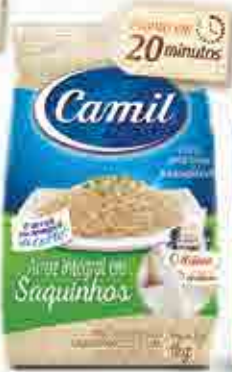
Arroz Integral em Saquinhos