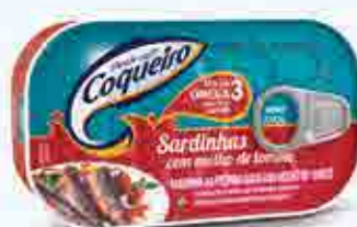
Sardinhas com Molho com Tomate