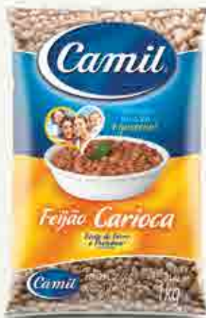
Feijão Carioca - Tipo 1

A linha de Feijão Camil possui uma grande variedade de grãos selecionados e é referência no mercado.