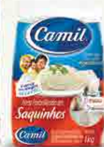
Arroz Parboilizado em Saquinhos