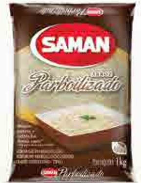
Arroz Saman Parboilizado T1