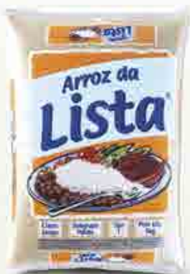
Arroz da Lista T1