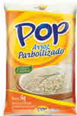
Arroz Pop Parboilizado T2