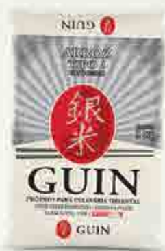
Guin Grão Curto