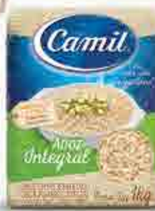
Arroz Integral a vácuo