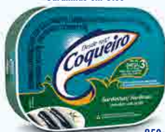
Sardinhas em Óleo