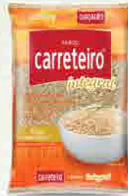
Arroz Carreteiro Integral