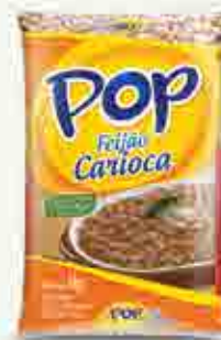
Feijão Pop Carioca T1