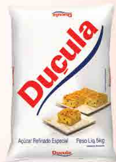
5kg Distribuição Regional SC - PR