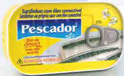
Sardinhas em óleo comestível - 125g