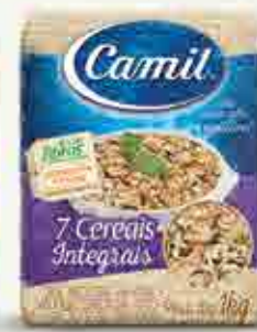
7 Cereais Integrais a vácuo