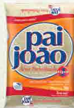
Arroz Pai João Parboilizado T1