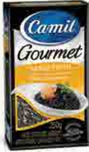
Arroz Preto Origem: Brasil