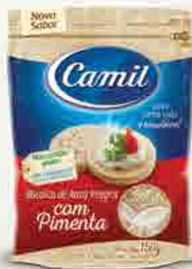
Biscoitos de Arroz Integral com Pimenta