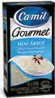
Mini Arroz Origem: Brasil