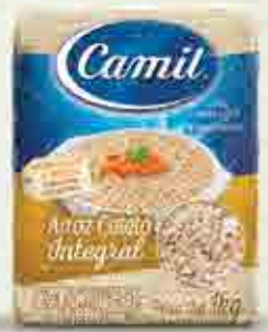
Arroz Cateto Integral a vácuo