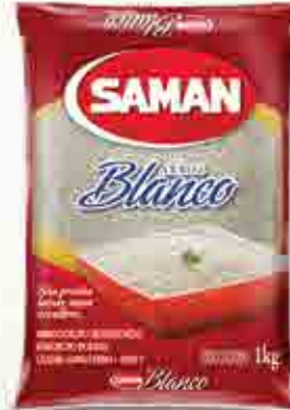
Arroz Saman Branco T1