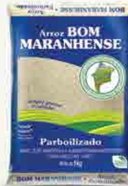
Arroz Bom Maranhense Parboilizado T1