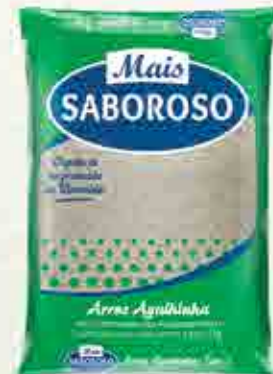
Arroz Mais Saboroso T2