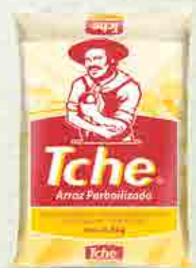
Arroz Tche Parboilizado AP