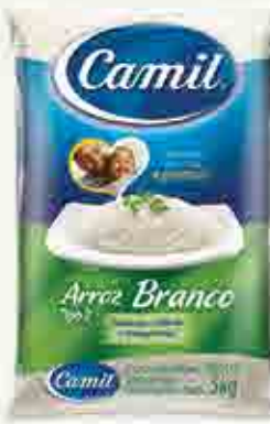
Arroz Branco - Tipo 2