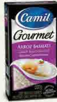
Arroz Basmati Origem: Paquistão, Índia e Tailândia