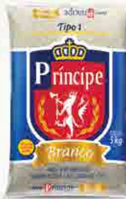
Arroz Príncipe Parboilizado T1