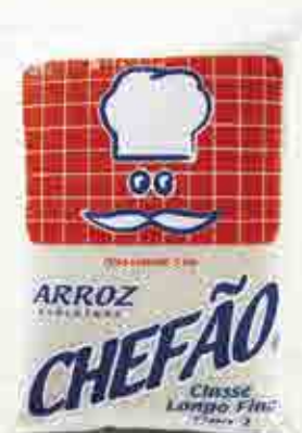
Arroz Chefão T1