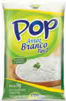
Arroz Pop Branco T1