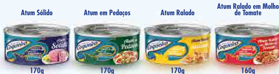
Atum em Pedacos - Food Service